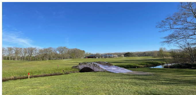
De Golfbrêge fan Aldemarrum

Commissie Bijzondere Zaken was weer druk in de weer met hun jaarlijkse 1 aprilgrap. Dit keer de keus uit een brug bij hole 9. Uw reacties waren voldoende om met genoeg hierop terug te zien. Dank.